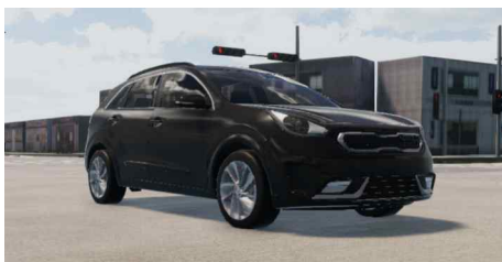
〈대회 3D 차량〉