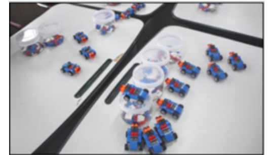
〈 판매를 기다리고 있는 완성된 제품들 〉