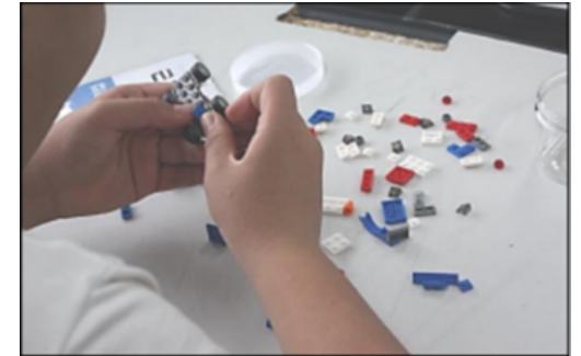
〈 제품 개발 과정 〉