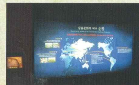
장류문화의 메카 순창