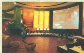
장류제조과정 및 도구