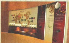
세계의 다양한 고추