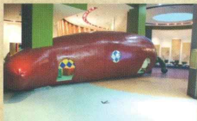
고추 속 탐험