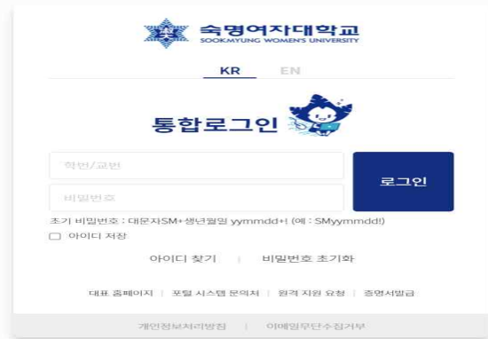
숙명포털시스템 학사 전반에 대한 정보를 제공하는 곳