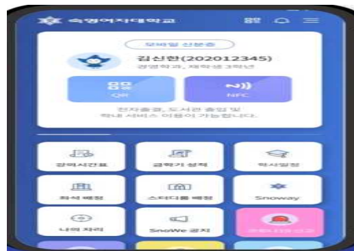
헤이영(APP) 숙명 모바일 서비스 종합 어플리케이션