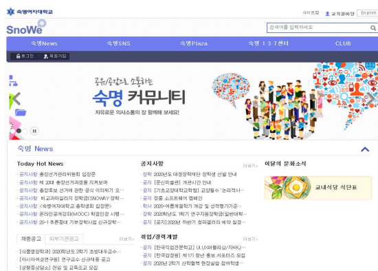
SnoWe(커뮤니티) 각종 공지사항을 확인할 수 있는 곳